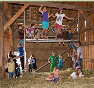
Heuhüpfen Stadel Nattenhausen