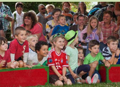
Viele Attraktionen warten... im gesamten Museums Gelände