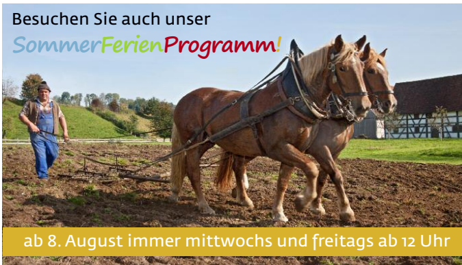
ab 8. August immer mittwochs und freitags ab 12 Uhr

Besuchen Sie auch unser SommerFerienProgramm!