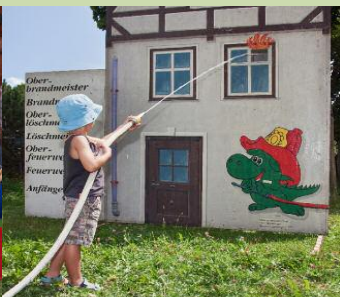
»Kinderfeuerwehr« Wiese Kapelle