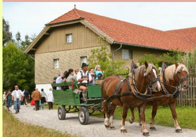
Kutschfahrten Abfahrt am Brunnen