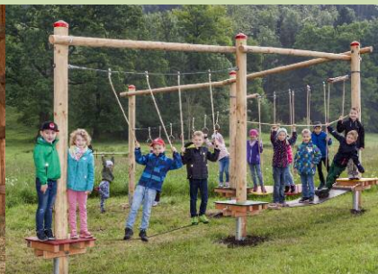
Niedrigseilgarten Torfwirtschaft „Otto Hamp“