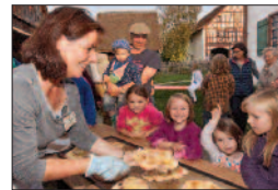
Obsttag 1. Oktober 2017