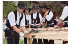
Handwerkertage 9./10. September 2017

Besuchen Sie auch unsere anderen Veranstaltungen!