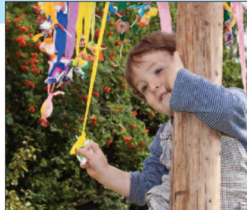
Kletterbaum Wiese Uttenhof (links)