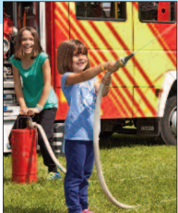
»Kinderfeuerwehr« Wiese Kapelle

Nach der Aufführung können die Kinder die Kunst des Seiltanzes unter Anleitung der Künstler selbst ausprobieren.