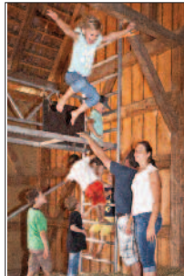
Heuhüpfen Stadel Nattenhausen

13.00 Uhr Offene, kostenfreie Museumsführung (Treffpunkt: Museumseingang)