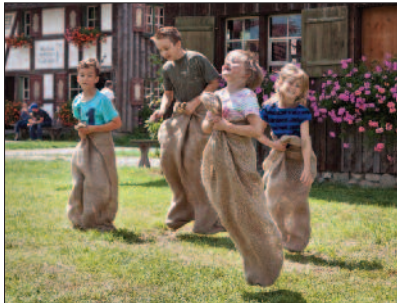
Alte Kinderspiele Kornspeicher Volkrathshofen